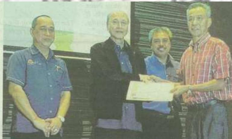
NIOSH chairman Tan Sri Lee Lam Thye (second from left) handing a certificate to an industry representative at a NIOSH appreciation programme in Sandakan yesterday.

"When OSH is integrated into the organisational culture and becomes a core value, involvement and commitment from top management down to the rank-and-file employees can be reinforced.