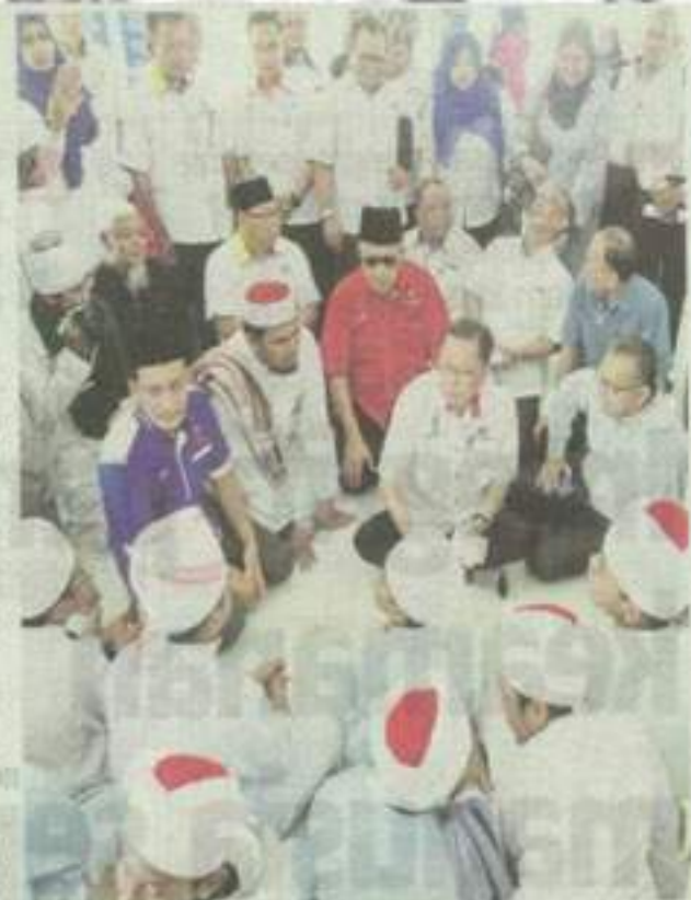
Ismail Sabri (tengah) bersama Menteri di Jabatan Perdana Menteri, Datuk Seri Shahidan Kasim dan Menteri Besar Perlis, Datuk Seri Azlan Man bertanyakan khabar pengajar Mahaad Tahfiz Al-Hikmah Libanbat, di Kangar, semalam.

"Kita jangka semuanya akan siap sepenuhnya pada Mei ini," katanya.