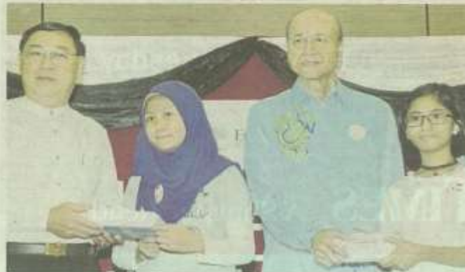
Eco World Foundation chairman Tan Sri Lee Lam Thye (second from right) presenting gifts to award recipients in Kota Kinabalu yesterday.

Lee, who is also Niosh chairman, said Eco World Foundation would set its budget depending on the schools' needs, adding that the joint effort was expected to start by June.