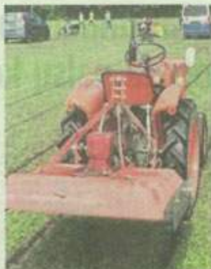
Traktor yang digunakan untuk memotong rumput di SMK Tunku Abdul Rahman, Gemas.