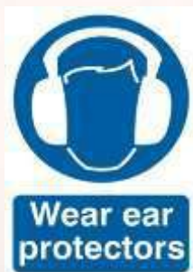
Tanda keselamatan alat pelindung pendengaran