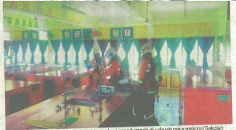
ANGGOTA bomba membersihkan cecair merkuri yang tumpah di sebuah meja makmal Sekolah Menengah Agama Al Madrasah Al Alawiyah Ad Diniah, Arau kelmarin.

kan tumpahan merkuri berlaku di atas meja. Namun, keadaan terkawal kira-kira 30 minit kemudian dan sisa tumpahan logam itu diserahkan kepada pihak sekolah untuk tindakan lanjut," katanya ketika dihubungi semalam. Difahamkan, tiada sebarang kecederaan dan kemalangan jiwa yang dilaporkan.