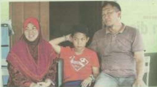
BERITA PUTUS TERKANA PINJAU TRAKTOR MUDA RUMPUT