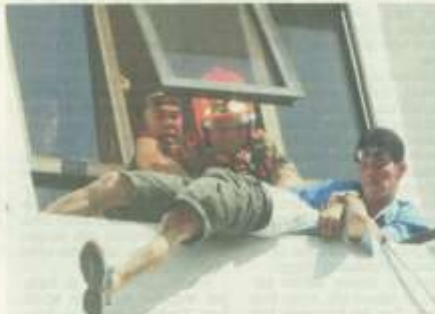
PENINGKATAN kecenderungan bunuh diri harus dilihat dengan serius kerana Kementerian Ia boleh dikaitkan dengan masalah kesihatan mental.

Pencegahan di peringkat awal sudah pasti mampu mengurangkan bebanrangkanian guru dan pelajar yang mengatami masalah