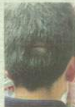
Mangsa yang cedera akibat terkena bilah pisau traktor mesin rumput.