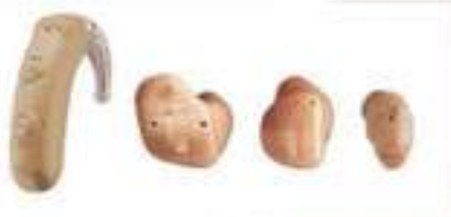
Beberapa jenis ABP yang boleh didapati

Ramai tertanya-tanya adakah mereka masih boleh bekerja setelah didiagnos mempunyai penyakit ini.