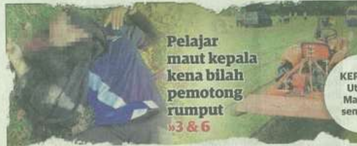
Pelajar maut kepala kena bilah pemotong rumput »3 & 6

"Warga sekolah, terutamanya pelajar perlu didedahkan kepada